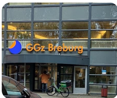
Bezoek CRA aan GGz Breburg