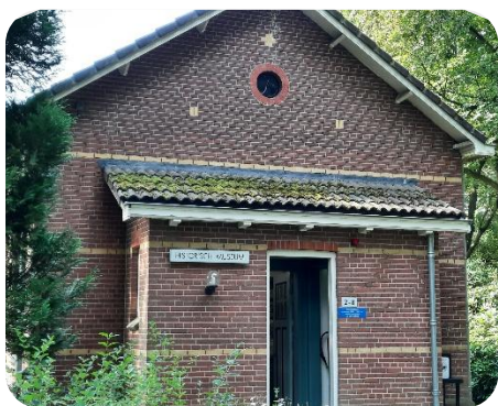
Bezoek aan het historisch museum Wolfheze

Daarnaast is er in september een workshop djembé geweest voor leden van het GOCR en RvB. Dit om eens op een andere manier met elkaar samen te werken.