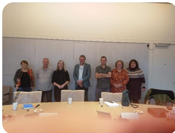
Bezoek van Menzis aan Pro Persona