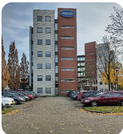
Gesprek bij Menzis